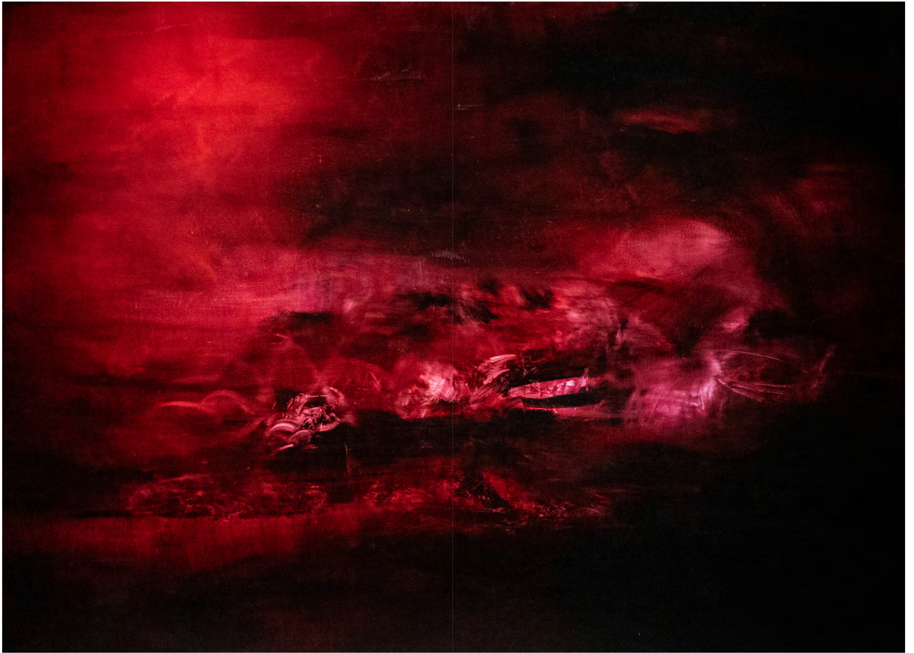
The Great Clod 2017.1. Oil on canvas, 130 × 180 cm, 2017