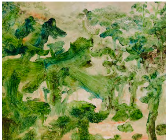
If My Homeland – Banana and Banana 3 Oil on canvas, 45 × 53 cm, 2025

La ville natale, dans son abstraction, n'est pas un point géographique fixe. Elle ressemble à un organe aux confins de la conscience, changeant sans cesse de forme, respirant à travers le temps et absorbant les émotions. Ce qui abritait autrefois de beaux souvenirs, après avoir été nourri sans fin d'images et d'informations, est devenu quelque chose qui ne m'appartient plus. Elle est désormais façonnée par la société, la technologie et la mémoire collective.