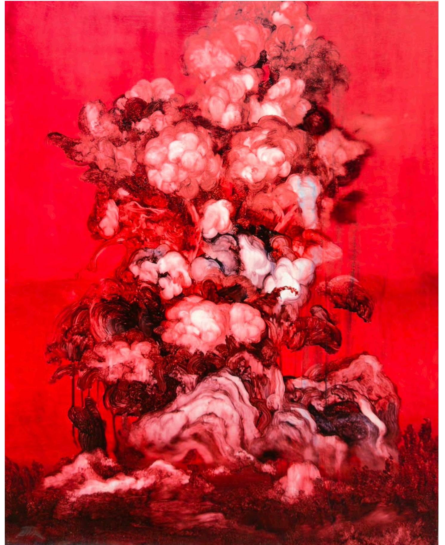
The Streaky Pork Series - Flesh Flowers and Birds - Hydrangeas in Bloom Oil on canvas, 91 × 72.5 cm, 2024