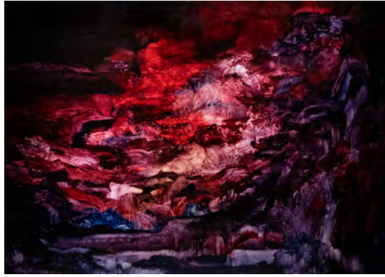
The Great Clod 2018.3 Oil on canvas, 130 × 180 × 5 cm, 2018

Hometown, in its abstraction, is not a fixed geographical point. It resembles an organ at the edge of consciousness, constantly shifting form, breathing through time, and absorbing emotion. What once held beautiful memories has, after being endlessly fed by images and information, become something no longer mine. It is now shaped by society, technology, and collective memory.