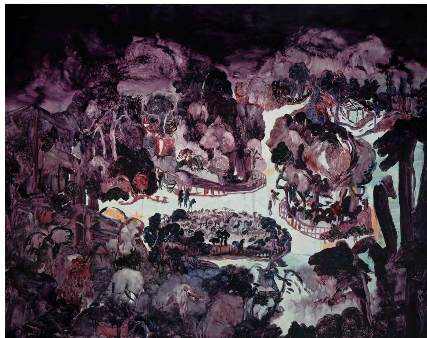
On the Brink of Paradise - The Botanical Garden Oil on canvas, 90.8 x 117 cm, 2024