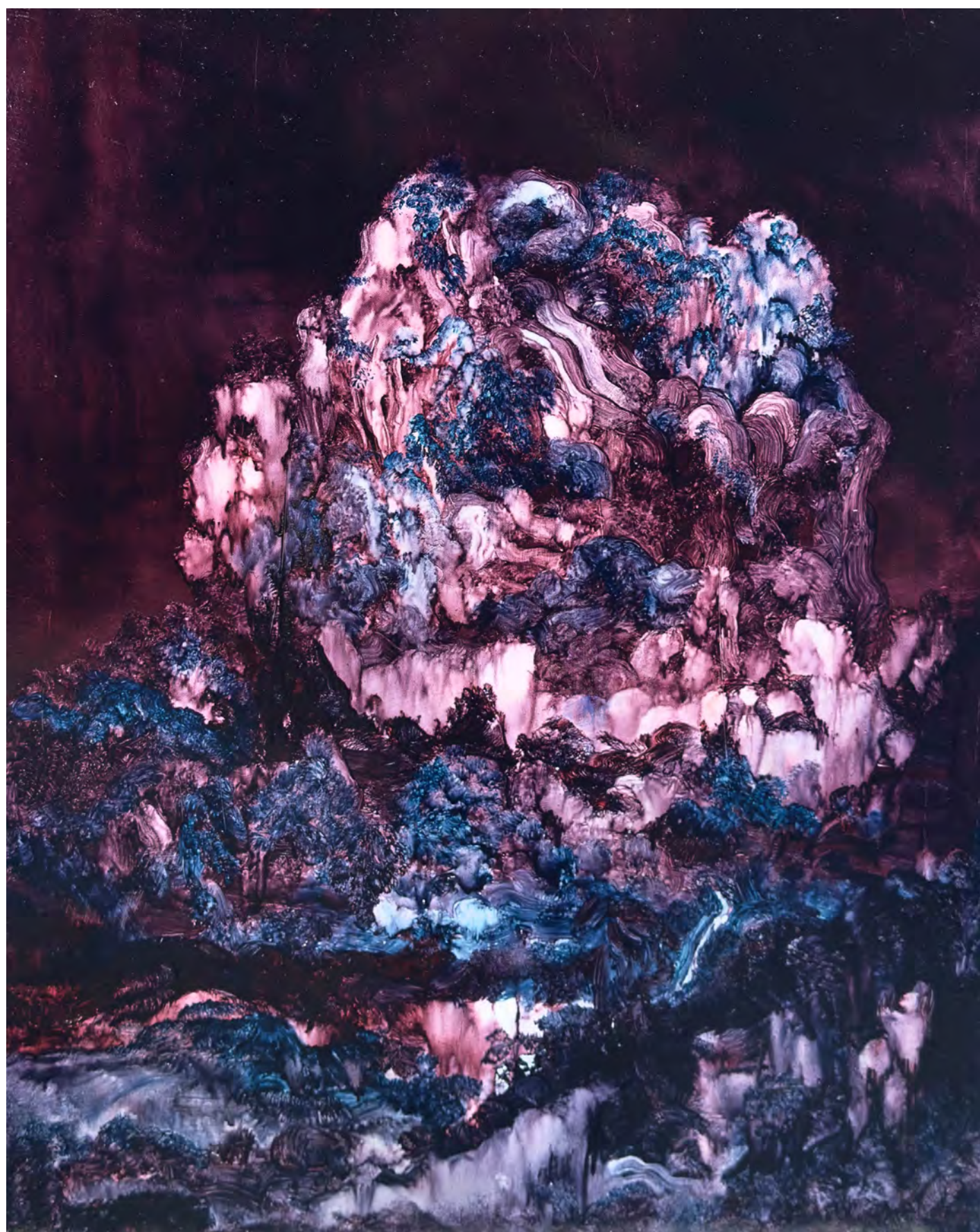
The Streaky Pork Series - Flesh Landscape - The Hill of Eternal Distance Oil on canvas, 91 x 72.5 cm, 2025