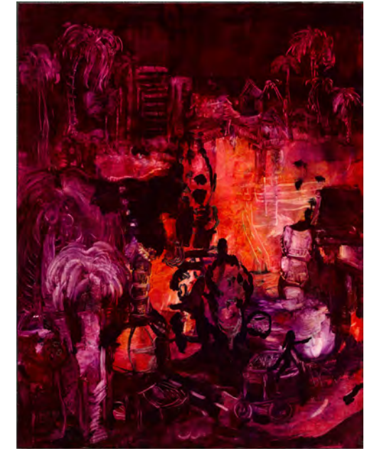
Peach Blossom Ballad Oil on canvas, 117 × 91 cm, 2025

Dans ce contexte, le déjà-vu nous amène à questionner la réalité du passé, tandis que la prédiction nous fait nous demander si l'avenir n'est pas déjà écrit. À travers cette série, Chang Ling invite les spectateurs à entrer dans une « double illusion » — une île qui abrite à la fois mémoire et prémonition — à la recherche de traces de ce qui demeure vivant dans un monde en surabondance.