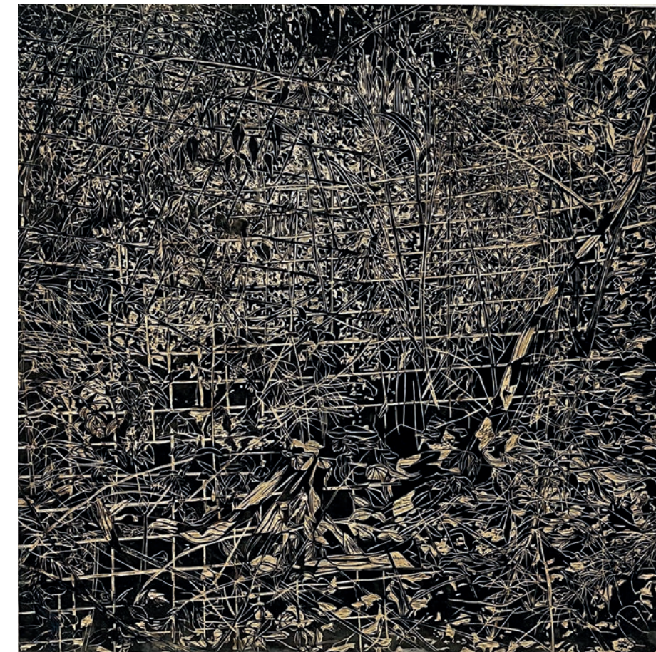
Nathalie VAN DE WALLE, Zone de non droit . Bois gravé, 1200x1100 mm