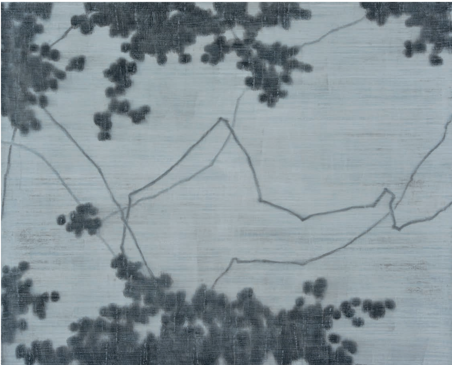
TREE NO.202406, Acrylic on canvas, 120x150cm, 2024