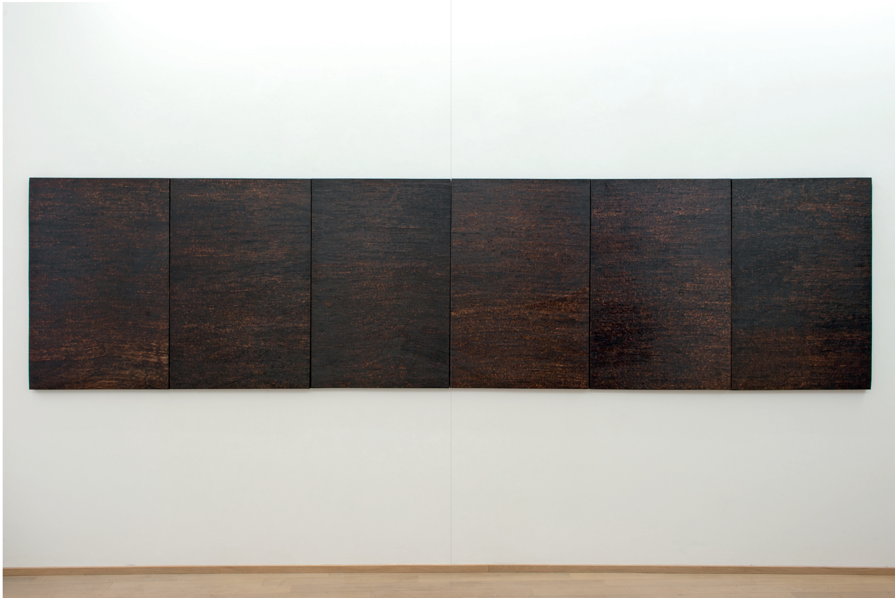
Les incertitudes, projet tactile, 6 panneaux de bois brûlé, 100 x 420 cm, 2018-2019 (Collections particulières : V / VI)