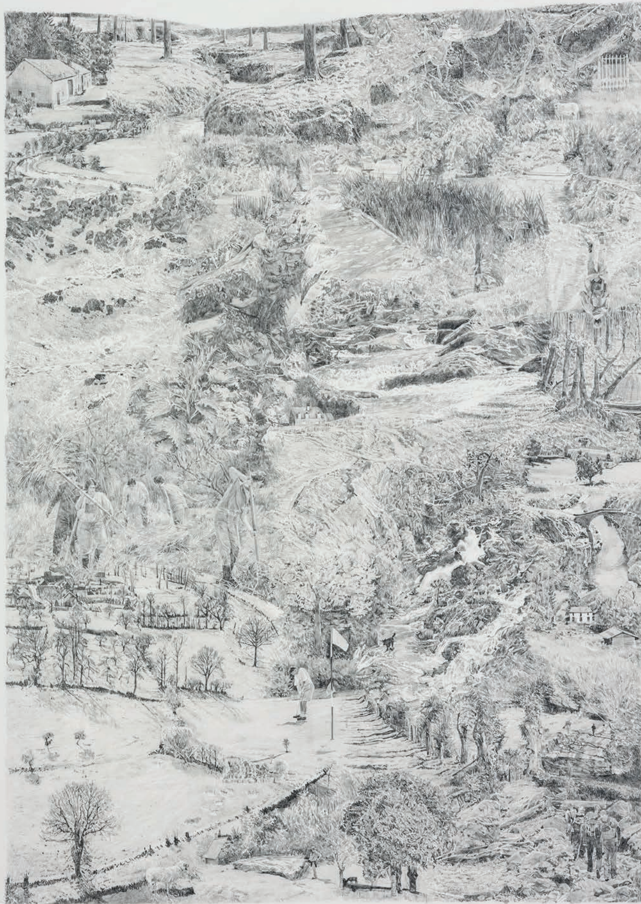
Anne Marie FINNÉ, Vue Générale XXI (Les foins) . Graphite sur papier, 50 x 35 cm, 2023