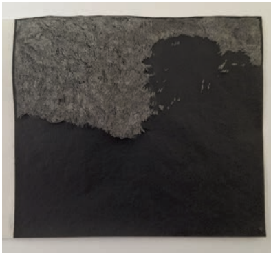
Anne Marie FINNÉ, D'après Jules Coignet (Vue du lac de Nemi) , Papier carbone gratté, 8,9 x 11,3 cm, 2024 ©l'artiste

arbres qui entourent son atelier lui suggère des formes qu'il laisse apparaître comme telles sur la toile ou sur le papier.