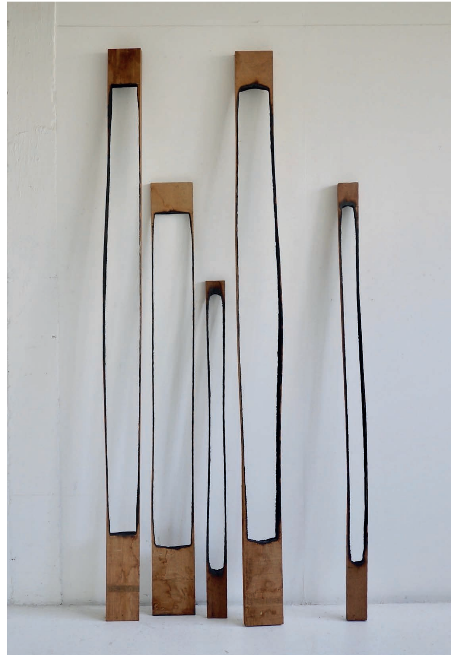
Sans titre, bois brûlé, 2021-2022, hauteur de 143 à 240 cm