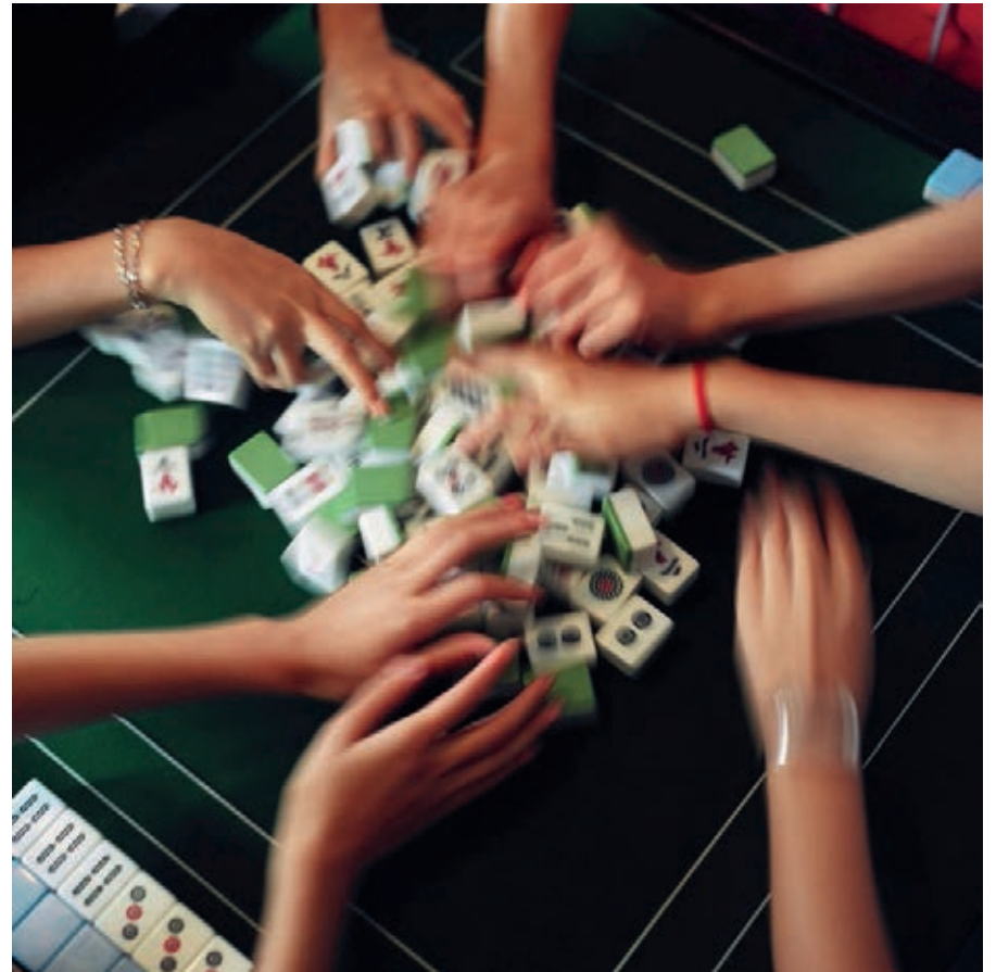
Octopus , 20x20 cm Guizhou, Chine 2006 Marie-Françoise Plissart