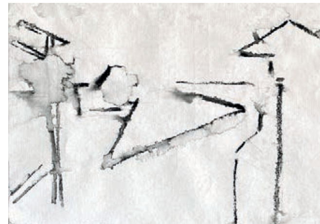
Point de vue du Gras d'après Nicéphore Niepce 16x22 cm et 10x15 cm Huile ou aquarelle sur papier Bruxelles 2023 Marie-Françoise Plissart