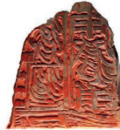
Face gravée du même sceau : le travail au burin doit pouvoir exprimer la vie du pinceau et la fluidité des jeux d'encre Pékin, Chine 2012 Lia Wei