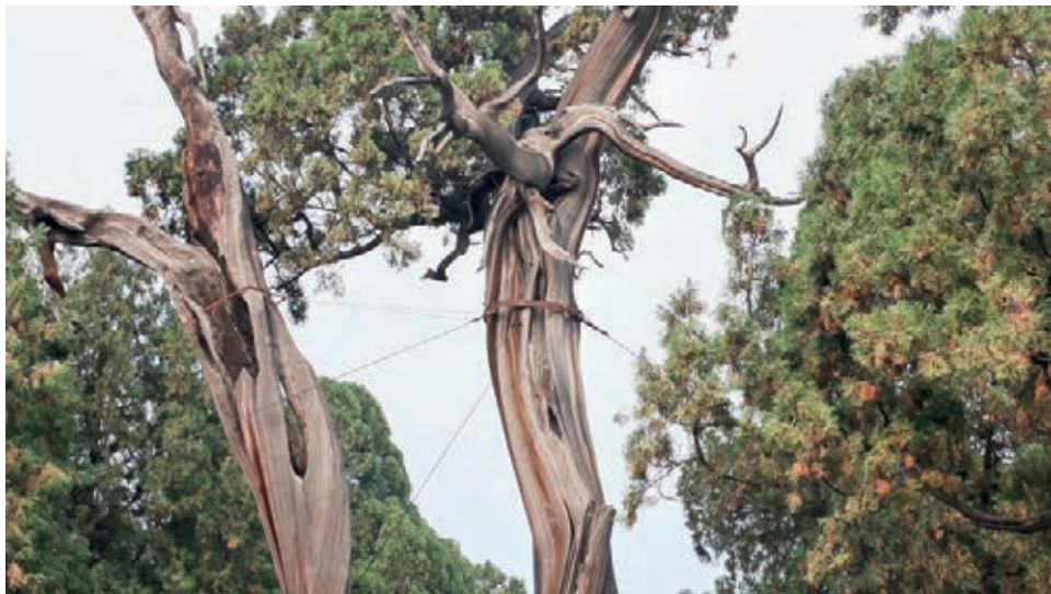
Cyprés millénaires dans la cour du temple Dai 20x35 cm, Tai'an, Chine 2011 Marie-Françoise Plissart