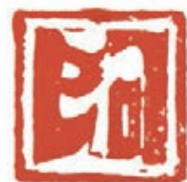
A 阿, 2 x 2cm Caractère chinois choisi par les traducteurs des oeuvres bouddhiques pour rendre la première lettre de l'alphabet sanskrit, exprimant la négation, ou l'absence Chongqing, Chine 2011 Lia Wei