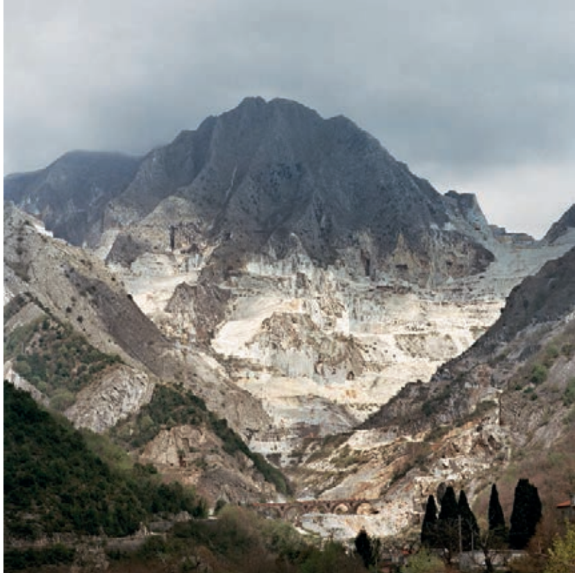
Carrare , 100x100 cm Italie 2005 Marie-Françoise Plissart