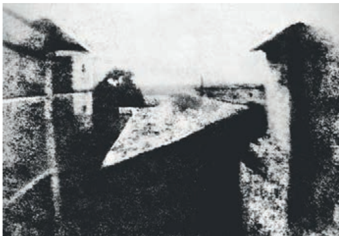
Point de vue du Gras , 16x22 cm Première photographie de l'histoire par Nicéphore Niepce, 1827 Voici l'image proposée par Marie-Françoise Plissart en réponse au sceau ci-dessous.