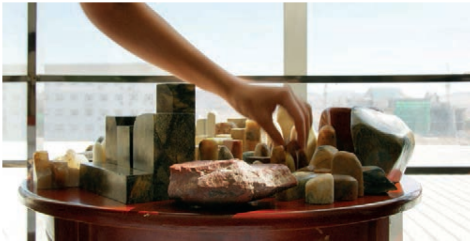
Voyage aux carrières de Balin, à la recherche de pierres à graver 10x20 cm. Mongolie Intérieure, Chine 2010 Lia Wei