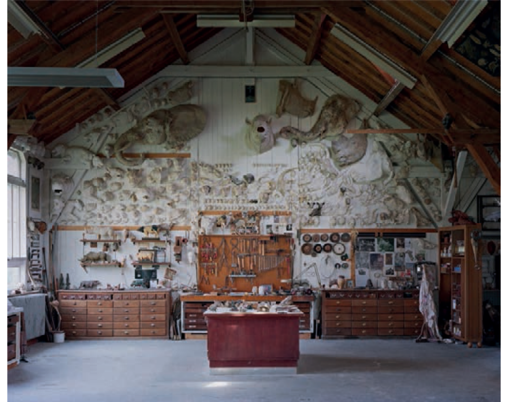
Trophée , 100x120 cm Atelier de Pierre-Yves Renkin Boudreville, France 2023 Marie-Françoise Plissart