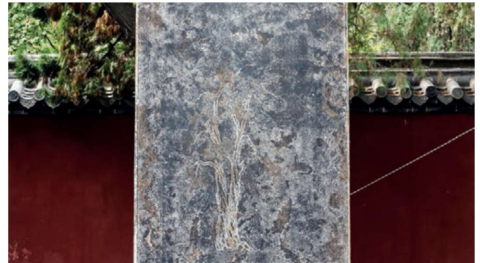
Portrait des cyprés par l'empereur Qianlong (1711-1799) gravé sur une stèle érigée à côté des cyprés, dans la cour du temple Dai, 20x35 cm, Tai'an, Chine 2011