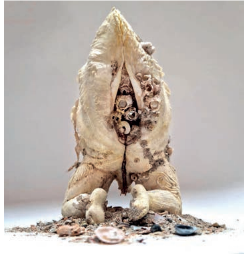
Ghita Remy, Vénus Bénitier, matériaux naturels, 20x10cm, 2021