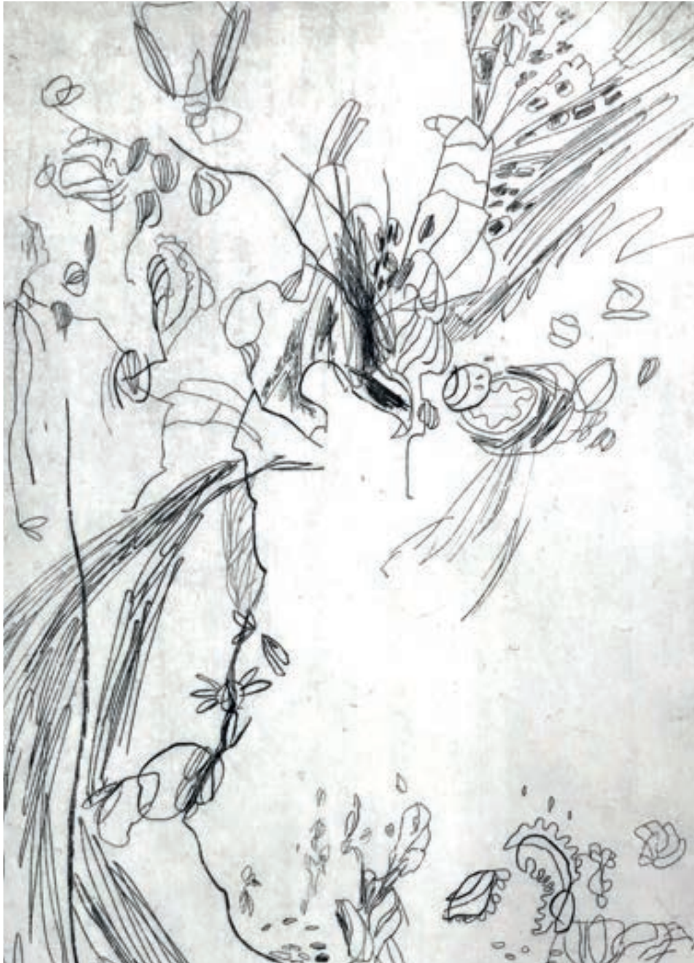
Albane Mauberquez, Evolution II Eau forte (impression sur papier), 21cm x 11,5cm, 2021