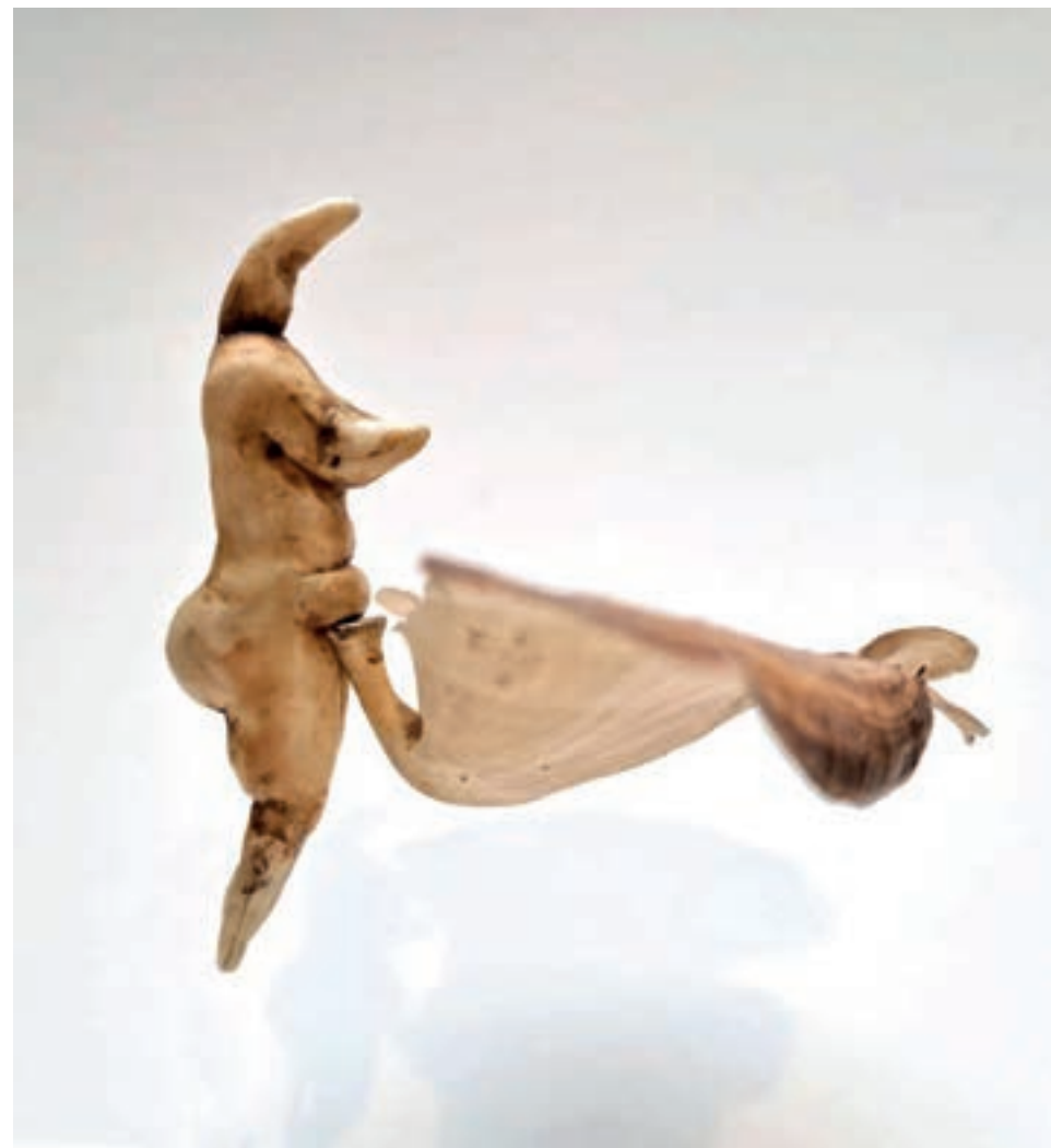
Ghita Remy, Vénus dentée Dents de félin, champignon tropical, matériaux naturels, 7x10cm, 2021