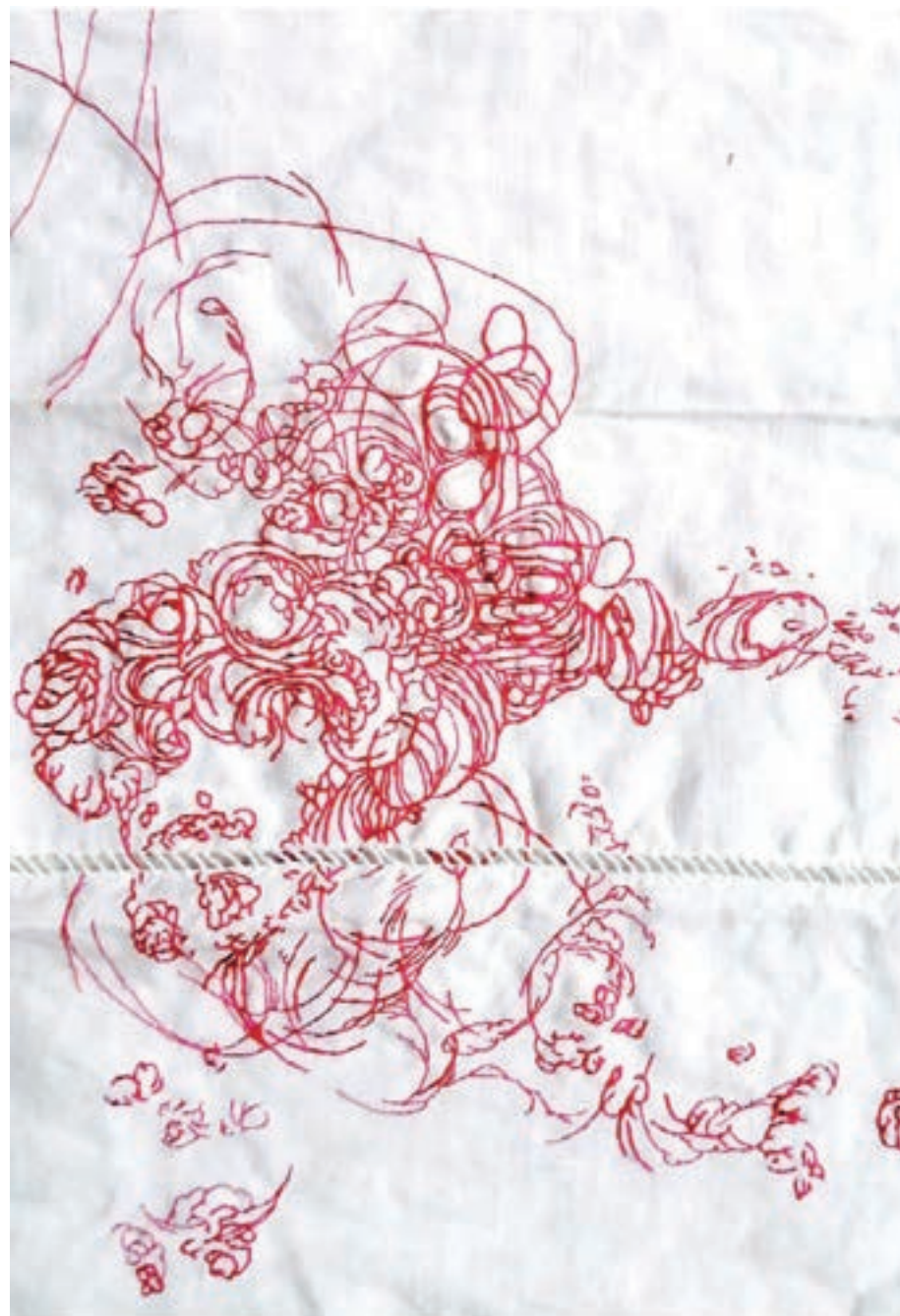
Albane Mauberquez, Caresse Broderie sur coton, 29,5cm x 23cm, 2021