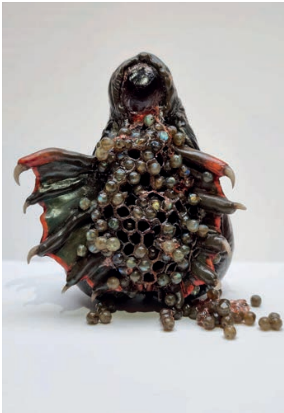
Ghita Remy, Vénus noire Verre, pierres, matériaux naturels, résine, peinture, 16x10cm