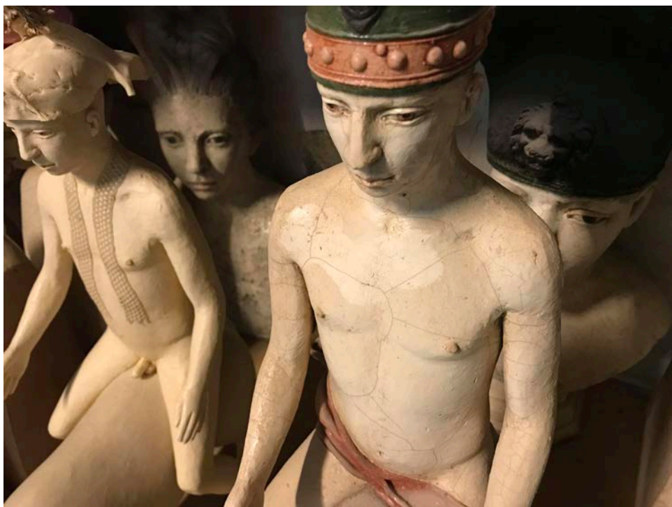
Terres cuites, atelier Photo Kiran Katara