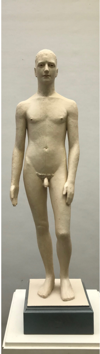
Terre cuite, Hadrien

ses tourments, de ses contradictions et surtout de son état originare.