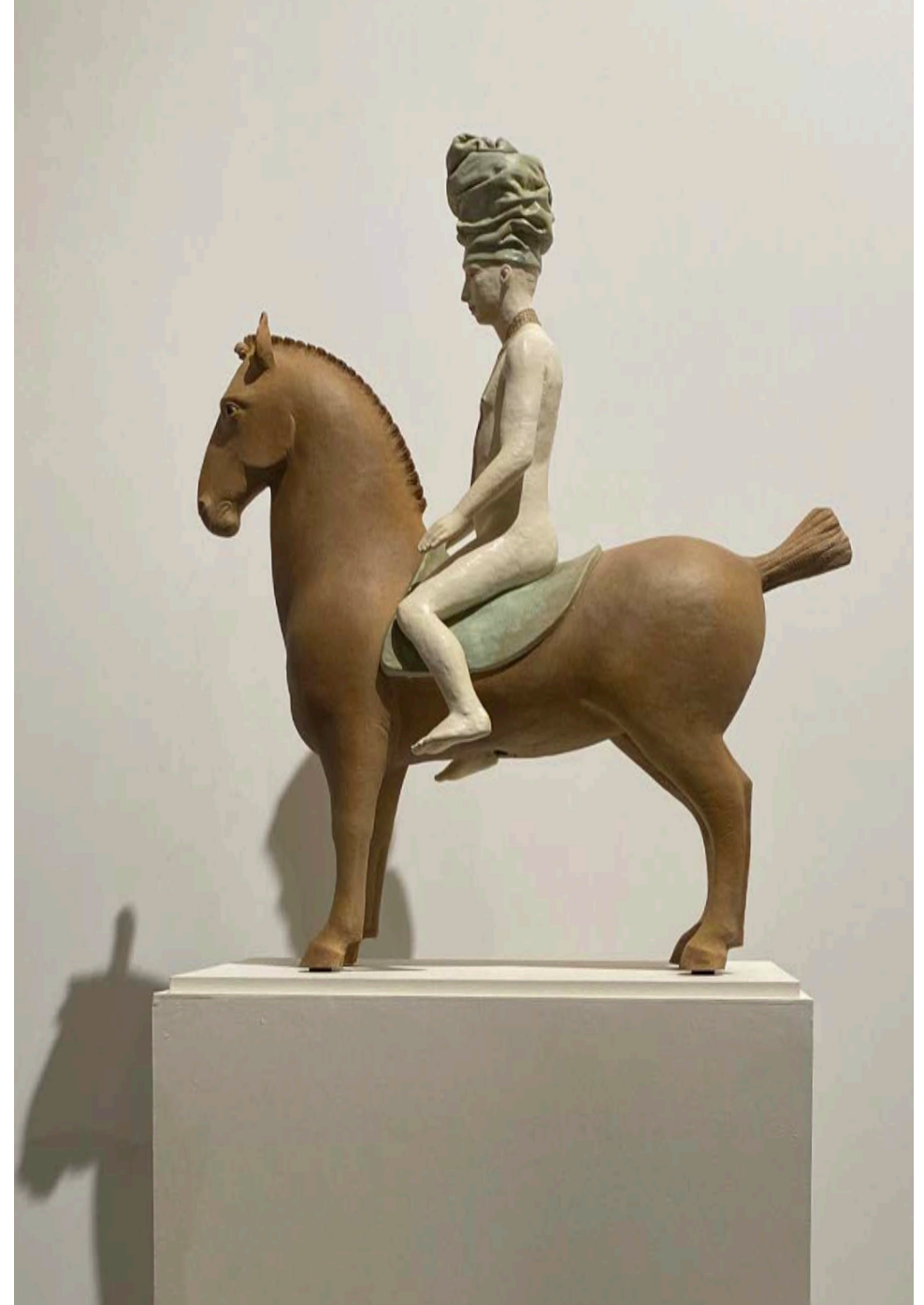
Terre cuite, Cavalier