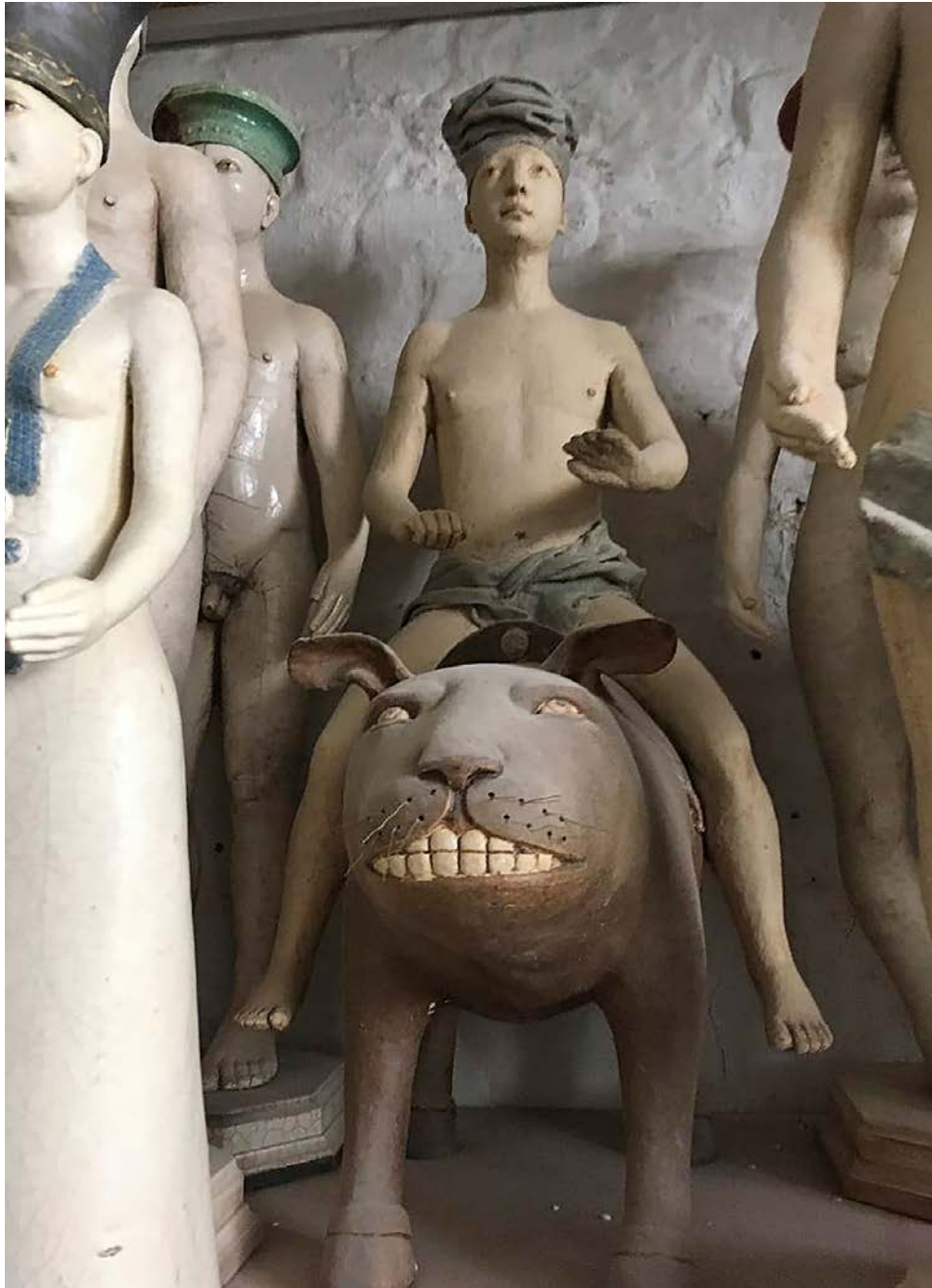
Terres cuites, atelier

En couverture : Terre cuite, Homme au poisson