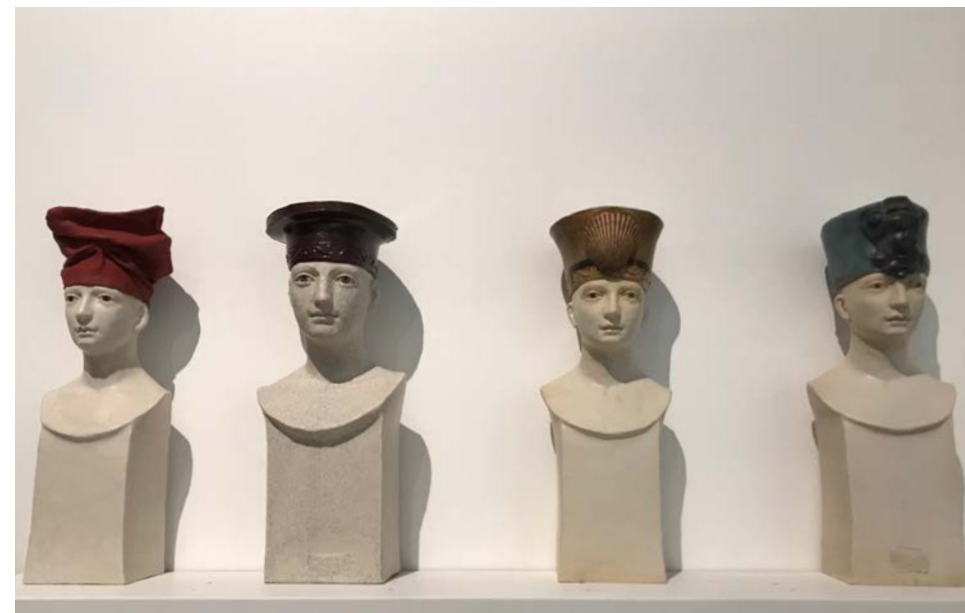
Terre cuite, Bustes

Apparaissent des textures profondes, des craquelures, des coutures. Elles se combinent à la finesse de la peau des visages et des corps, leur donnant tout le mystère et l'élégance que l'on ressent. L'impensé, le relatif, l'aléatoire, le poétique surgissent. La terre laisse des traces, se souvient. Il faut accepter l'irréversible.