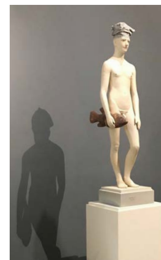
Terre cuite, L'homme de la mer