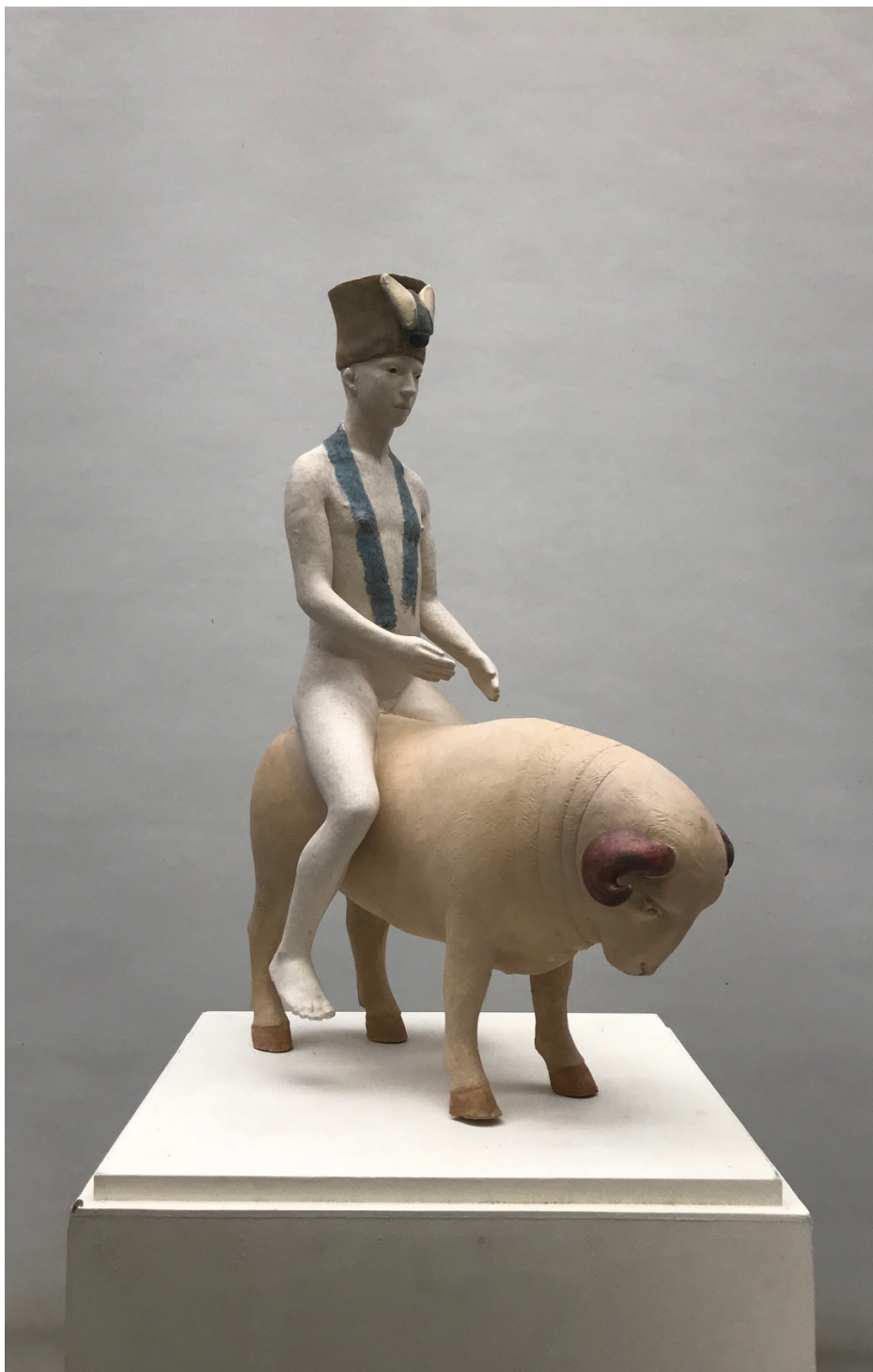
Terre cuite, Homme sur bélier