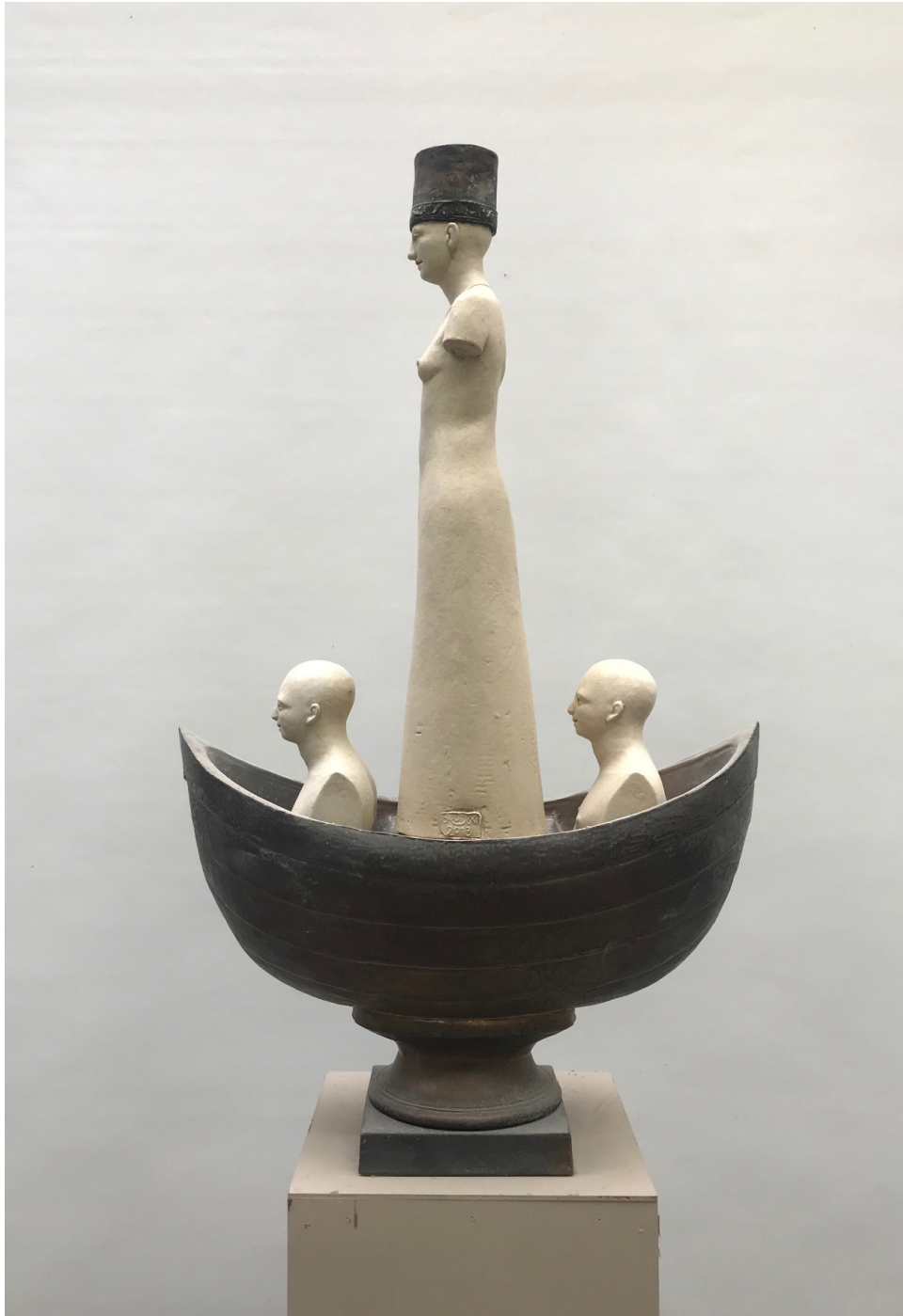
Terre cuite, L'espérance