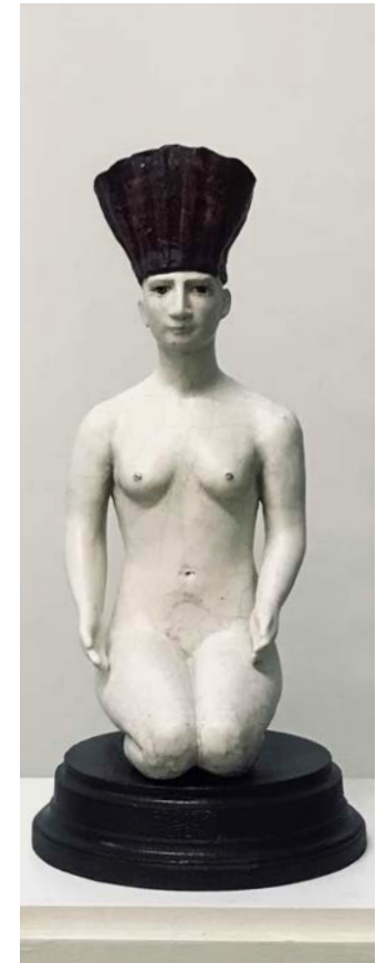
Terre cuite, La naissance de Vénus