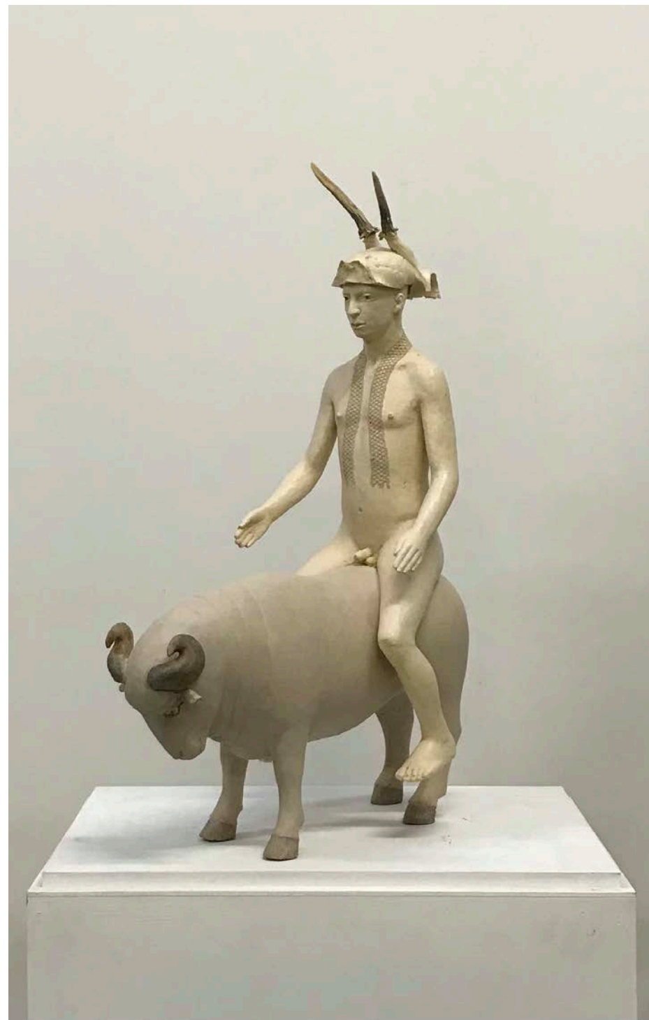
Terre cuite, Le passeur de mort